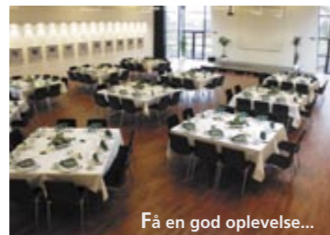
Få en god oplevelse...

Kultursalen er på 240 m 2 . I tilknytning til kultursalen er der en lille sal på 65 m 2 , køkken, anretterrum og kølerum. I kultursalen kan der være 150 - 170 spisende gæster. I den lille sal er der plads til 40 - 45 spisende gæster. Kultursalen og den lille sal lejes ud med køkkenpersonale. Ring og bestil vort menukort.